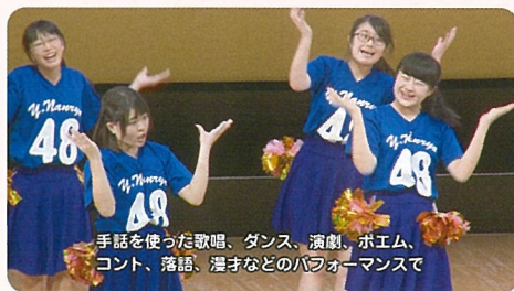
鳥取県 第3回手話パフォーマンス甲子園 (2016年)