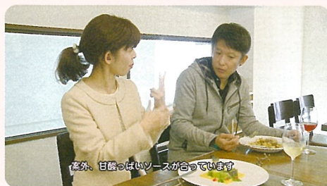
「たか&あやのほろ酔いカフェ」 (2016年)