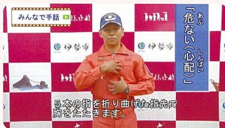
三重県伊勢市 みんなで手話動画