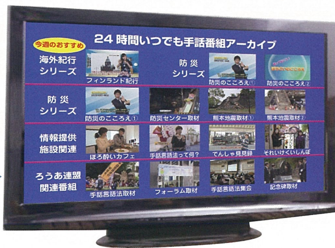
※画面はハメ込み合成です。

IPTV「目で聴くテレビ」を ご利用いただくには、インター ネット光回線が必要です。