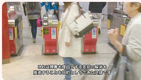
「交通のバリアフリー」 (2016年)