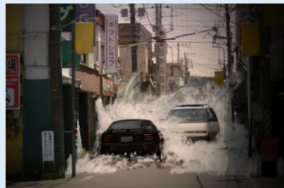
巨大津波による被害