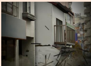
強い揺れによる 建物崩壊