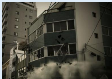
強い揺れによる 建物崩壊