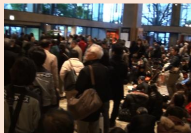
帰宅困難者の大量発生