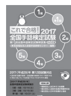
「これで合格! 2017 全国手話検定試験(DVD付き)」 (2017年6月刊行予定)