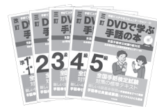
「DVDで学ぶ手話の本」シリーズ 5級～2級(三訂版) 準1級・1級(改訂版)