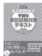
「改訂 よくわかる! 手話の筆記試験対策テキスト」