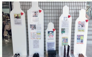
生命のメッセージ展in三重